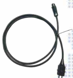
Câble AC + Prise EU 12 AWG