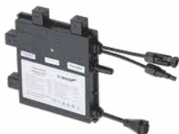
Sol-H350 x 1