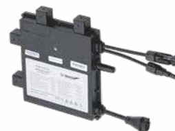
Sol-H350 x 1