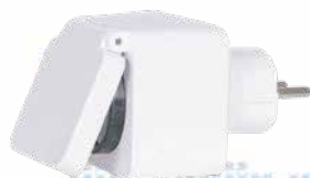
Compteur intelligent x 1