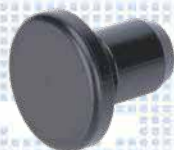
Bouchon x 2