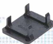
Déconnexion du connecteur T x 1