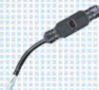
Câble AC nu extension 12 AWG