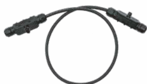
Bus AC 12 AWG